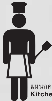
แผนกครัว Kitchen