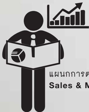
แผนกการตลาดและการขาย Sales & Marketing