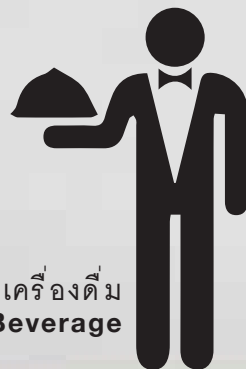
แผนกบริการอาหารและเครื่องดื่ม Food & Beverage