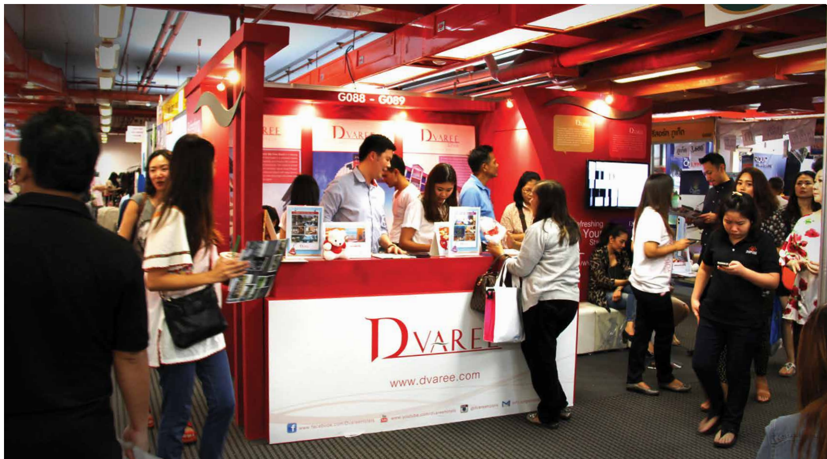
(Photo) Welcome D Varee booth at 30th Thai Tiew Thai during 27 February to 2 March.