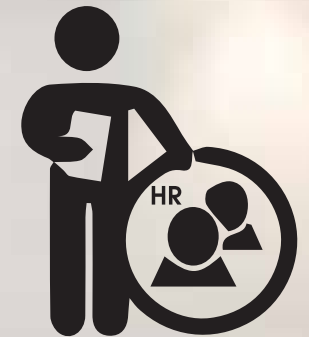
แผนกทรัพยากรบุคคล Human Resources