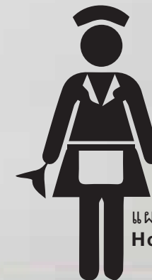
แผนกแม่บ้าน Housekeeping