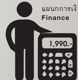
แผนกการเงิน Finance