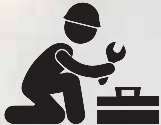
แผนกวิศวกรรมและบำรุงรักษา Engineer & Maintenance